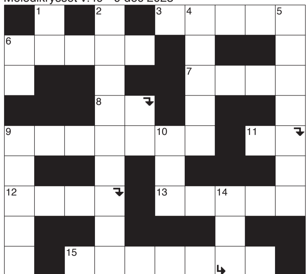
Melodikrysset v.49 - 9 dec 2023

Melodikrysset lördag kl. 10.03 i P4. Lösningen ska vara inne senast onsdag i nästa vecka