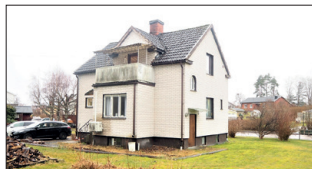
1,5 plansvilla på Norra stadsdelen