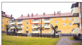
Ljus 4:a i Björnen

Noga med att välja mäklare? Välkommen till den lokala mäklaren.