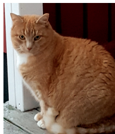
Olof Pihlgren, Gästkåser